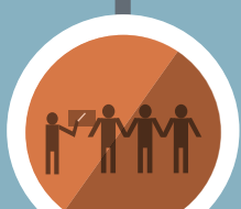
မိဘဆရာပူးပေါင်းပါဝင်မှု

ကျောင်းတိုင်းတွင် မိဘများပါဝင်တက် ရောက်သော အလှည့်ကျ အစည်းအဝေး များရှိပါသည်။