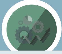
ကျောင်းစီမံခန့်ခွဲမှု

MLC ကျောင်းများတွင် နှစ်စဉ် ငွေစာရင်း စစ်ဆေးခြင်းများ ပါဝင်သော တာဝန်ခံမှု လုပ်နည်းကိုင်နည်းများလည်း ရှိပါသည်။