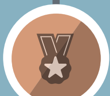
ကျောင်းသားများ အသိအမှတ်ပြုခံရမှု

အသိအမှတ်ပြုခံထားရသော ပညာရေး လမ်းကြောင်းများ တစ်ခုထက်မက ရှိပါသည်။ ၎င်းတို့မှာ ထိုင်းနိုင်ငံကျောင်းပြင်ပ ပညာရေး (NFE)၊ မြန်မာပြည် ကျောင်းပြင်ပ မူလတန်းပညာရေး (NFPE) နှင့် မြန်မာပြည် စီချိန်စံညွှန်းမီ ၄တန်း၊ ၈တန်းနှင့် ၁၀တန်း စာမေးပွဲများ စသဖြင့်ပါဝင်သည်။ အစိုးရ ပညာရေးဌာနများနှင့်ပူးပေါင်းဆောင်ရွက်မှုများလည်း တိုးပွားလာသည်။ အချို့ကျောင်း ဆရာ/မများက မြန်မာပြည်တွင်ကျောင်းပြင်ပ မူလတန်းပညာရေးနှင့် ၁၀တန်းအတွက် သင်တန်းများတက်ရောက်ခဲ့သည်။