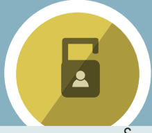
ကလေးကာကွယ် စောင့်ရှောက်ရေး

MLC ရွှေ့ပြောင်းပညာရေးကျောင်းများတွင် အခြေခံကျသော ကလေးကာကွယ် စောင့်ရှောက်ရေး စနစ်ထားရှိပြီး ဆရာ/မများအပါအဝင် ပညာရေးဆိုင်ရာ ဝန်ထမ်းများအားလုံး နှစ်စဉ် ကလေးကာကွယ်စောင့်ရှောက်ရေး သဘောတူညီမှု ဖောင်များကို ဖြည့်စွက်လက်မှတ်ရေးထိုးရပါသည်။